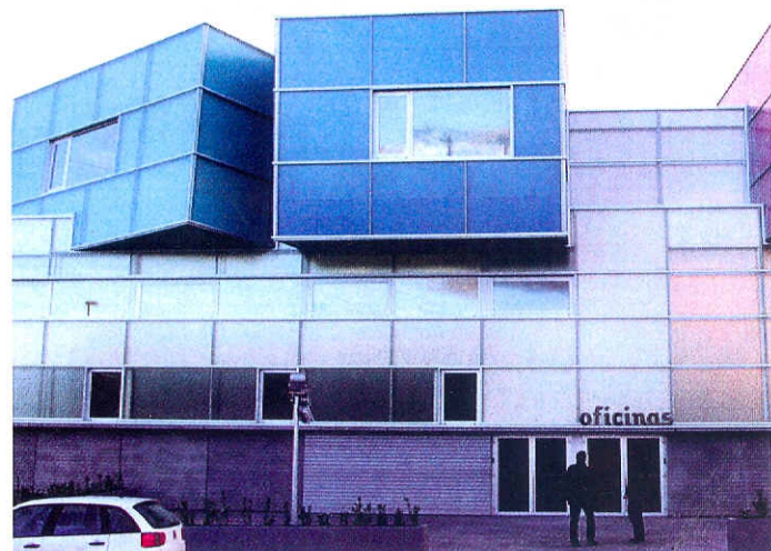
■ Exterior del proyecto de la sede de la empresa Tuc Tuc